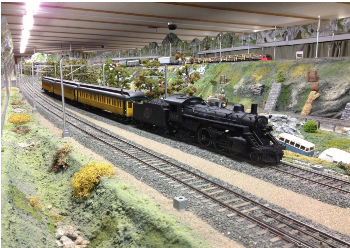
# 517 mit ihrem Extrazug in ihrer neuer Umgebung