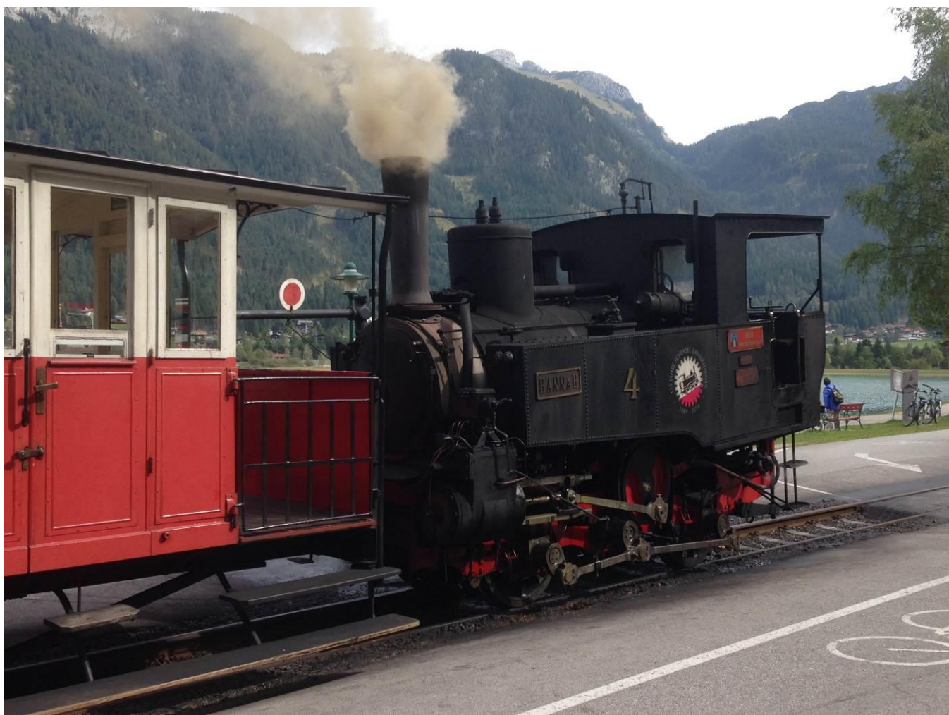
...am Achensee im Tirol... Herbstreise BMEC im September 2015