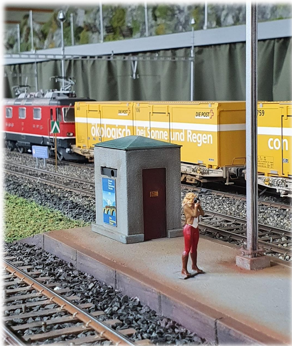
Eine der neuen Attraktionen beim Bahnhof Capolago: Unsere Smartphone-gesteuerte Eisenbahn-Fotografierstation