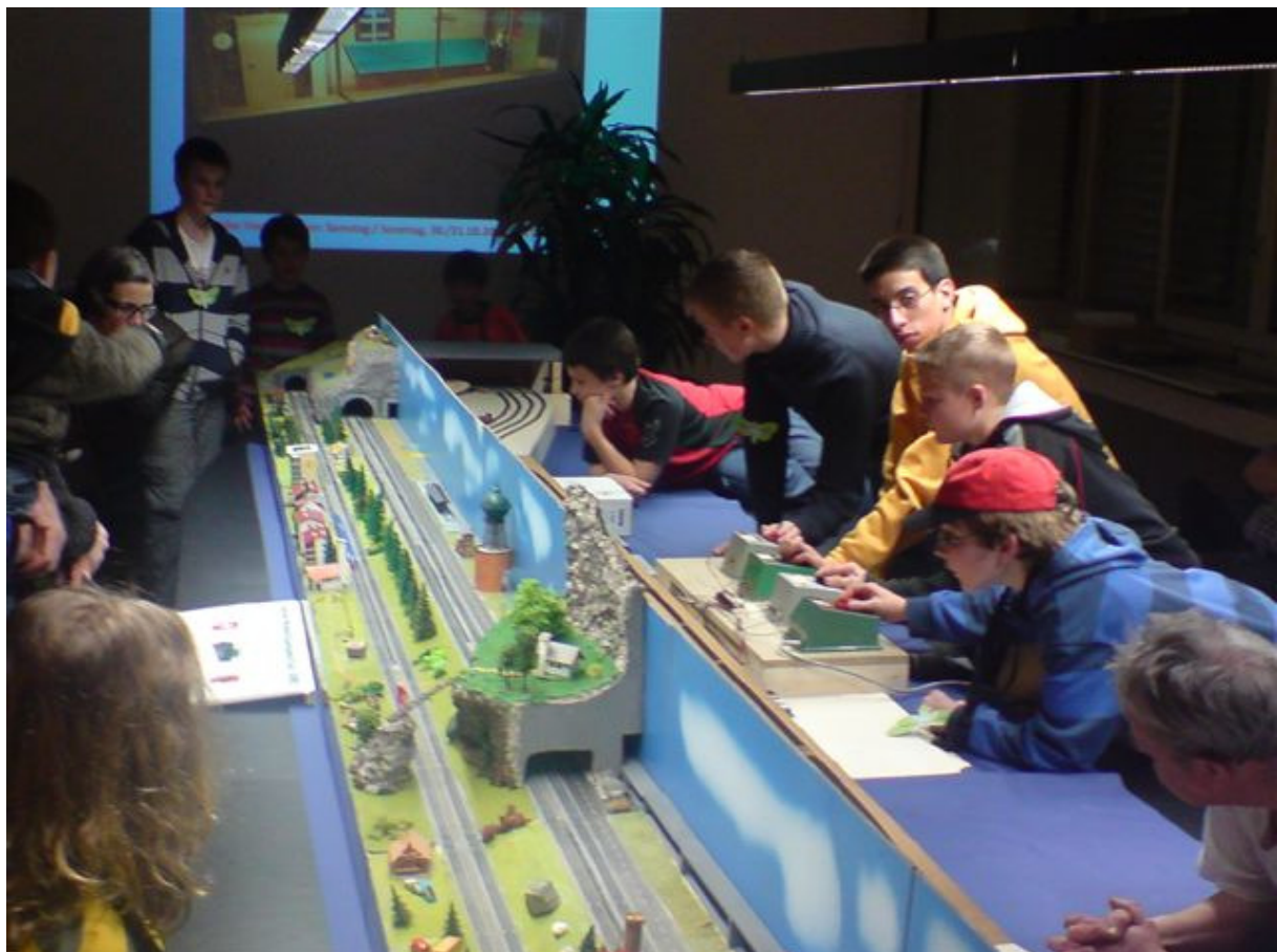
Die Jugendgruppe in Aktion mit der N-Modulanlage an der Museumsnacht 2010